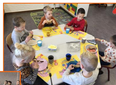
Groep instroom/ 1a gezellig aan het schoolontbijt