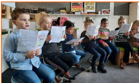
Groep 2a viert Dankdag