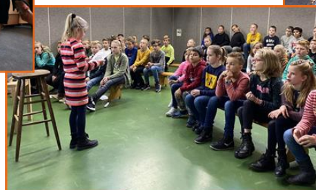
Dankdagviering van groep 5, 5/6 en 6 in het spellokaal