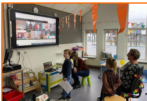
Online afscheid van juf Admiraal