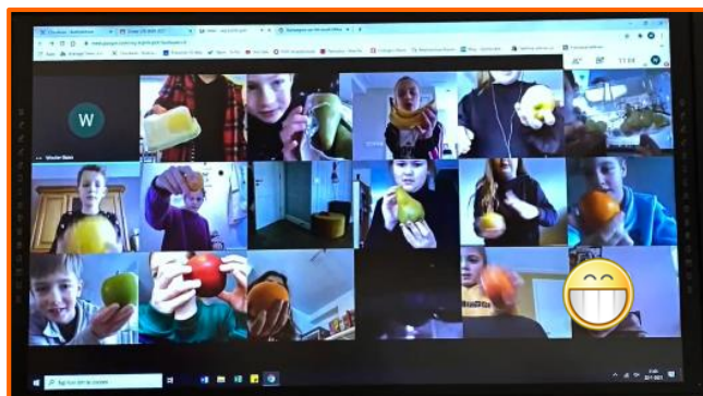
Fruit verzamelen met groep 5b