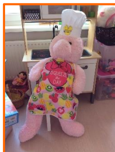
Thema 'beroepen': de bakker van Naomi uit groep 2a!